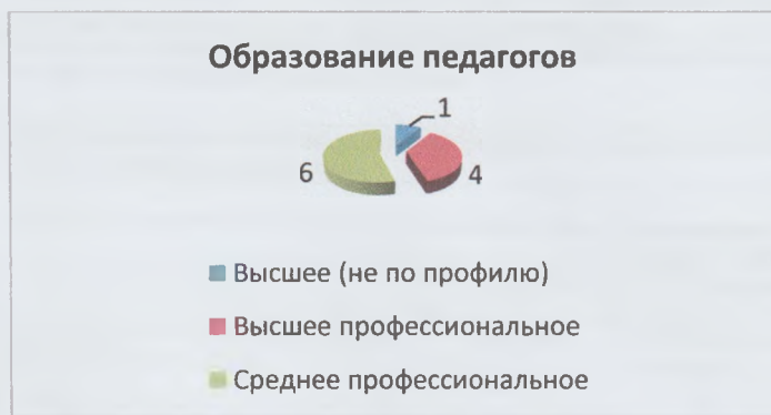
Диаграмма с характеристиками кадрового состава МБДОУ № 7:

100% педагогов соответствуют специализации по должности.